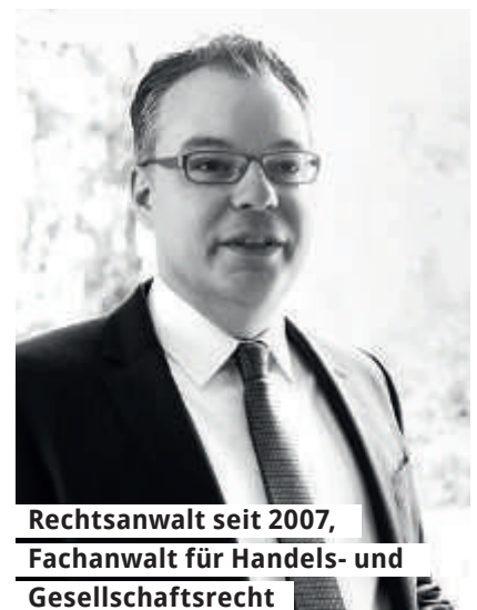
Rechtsanwalt seit 2007, Fachanwalt für Handels- und Gesellschaftsrecht