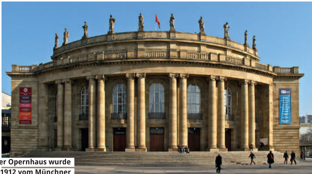
Das Stuttgarter Opernhaus wurde von 1909 bis 1912 vom Münchner Architekten Max Littmann erbaut.