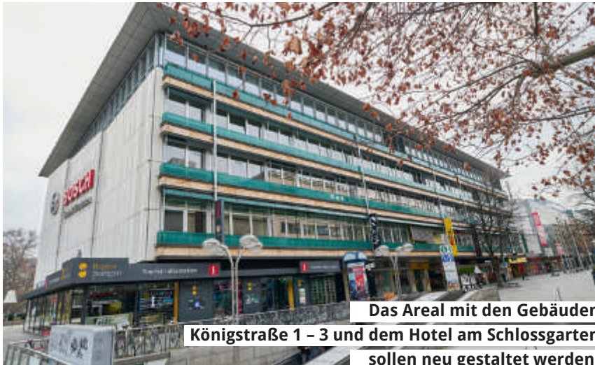
Das Areal mit den Gebäuden Königstraße 1 – 3 und dem Hotel am Schlossgarten sollen neu gestaltet werden.

Stadt Stuttgart ist dagegen und argumentiert, dass ein „ Mischgebäude “ keine gute Lösung sei, da ein Opernhaus und ein Konzerthaus unterschiedliche Anforderungen an die Architektur und die Akustik hätten (Stichworte: Bühnenturm und Orchestergraben).